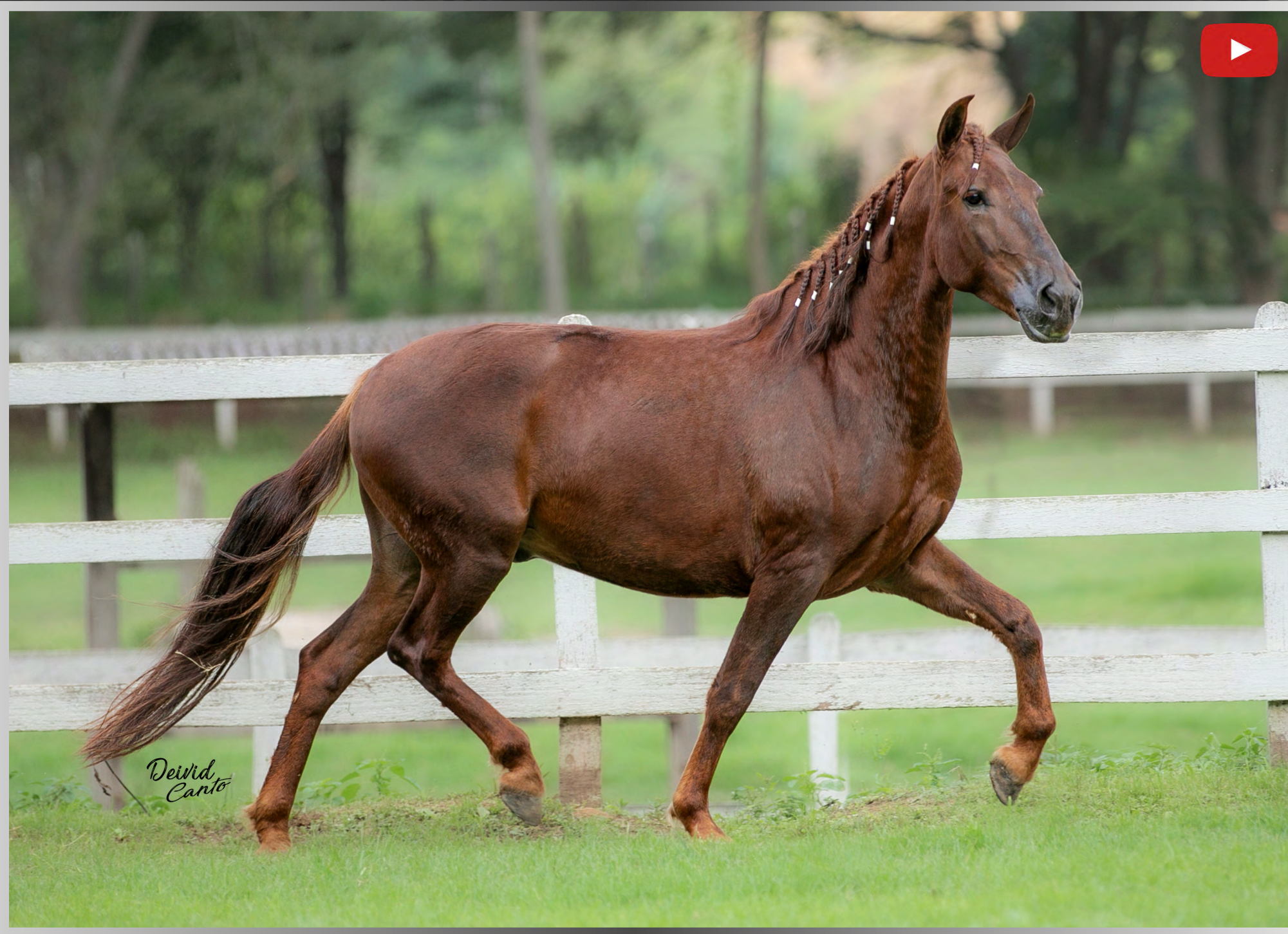
Seu Pai LOGAN RIO RASO

CASTRADO • NASCIMENTO: 15/04/2021 • VENDEDOR HARAS RF1 - NOVA FRIBURGO/RJ