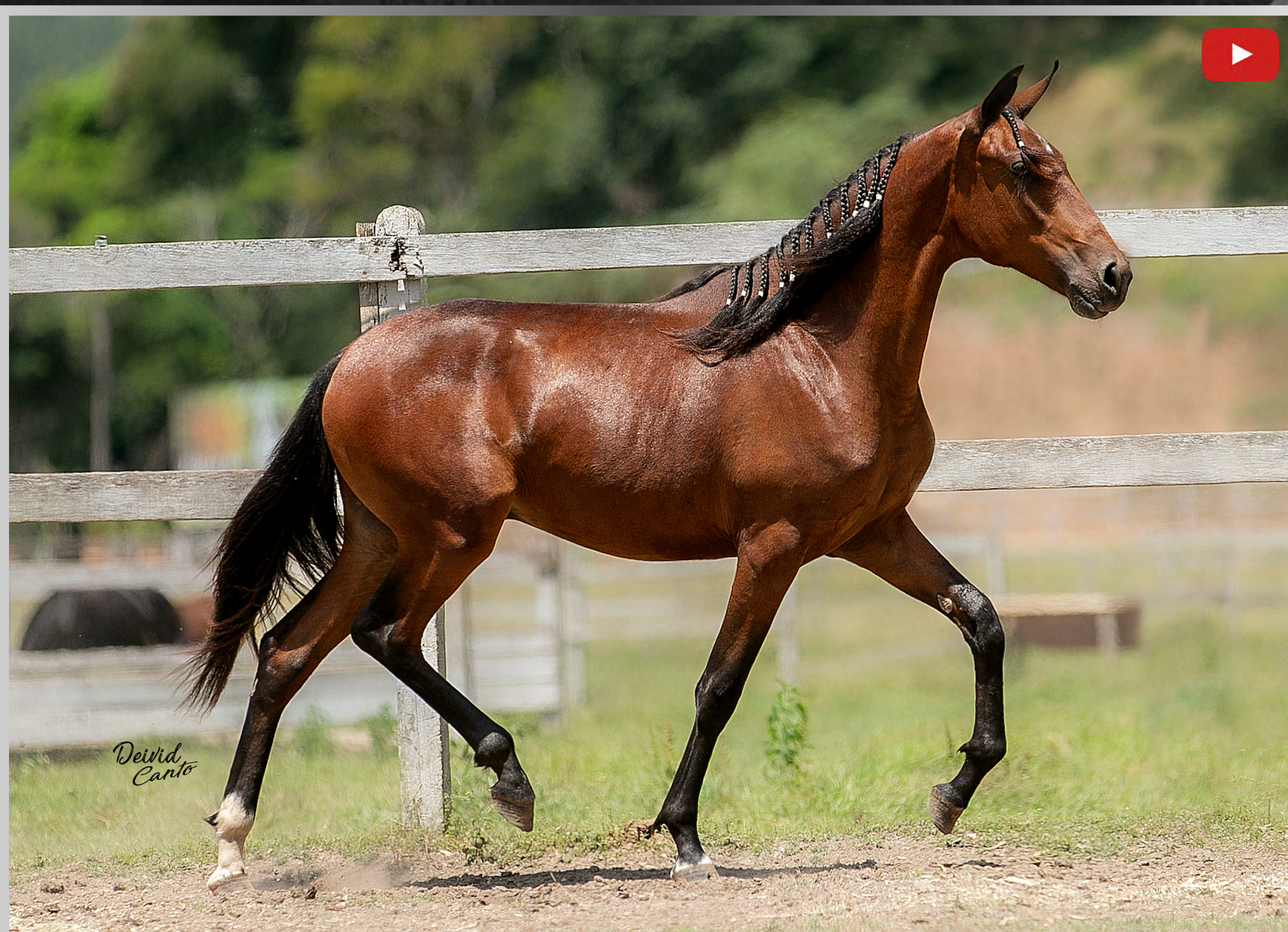
Seu Pai FIGO DO YURI

MACHO • NASCIMENTO: 30/09/2023 • VENDEDOR HARAS RFI - NOVA FRIBURGO/RJ