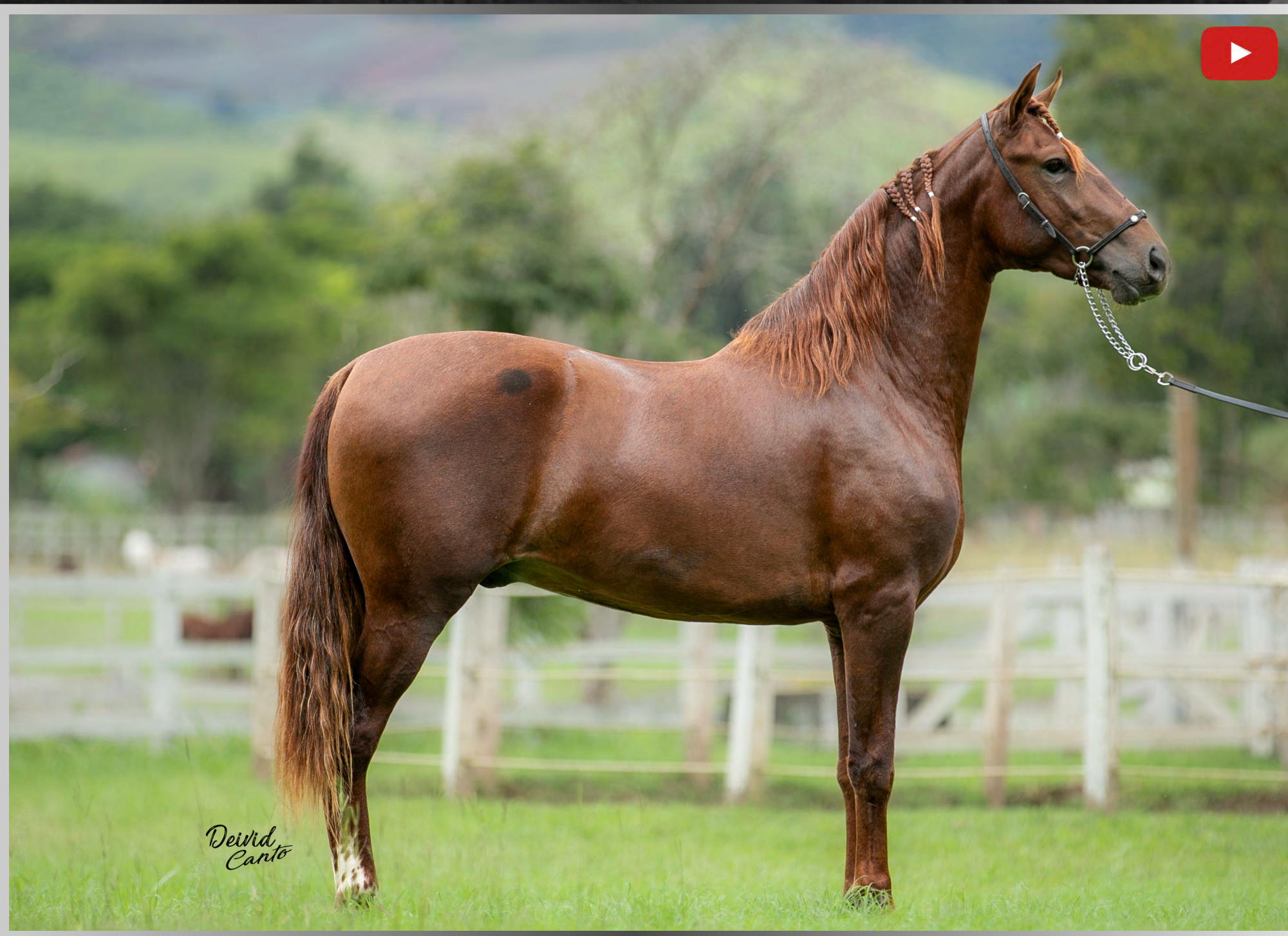
Seu Pai LOGAN RIO RASO

MACHO • NASCIMENTO: 10/02/2023 • VENDEDOR HARAS RFI - NOVA FRIBURGO/RJ