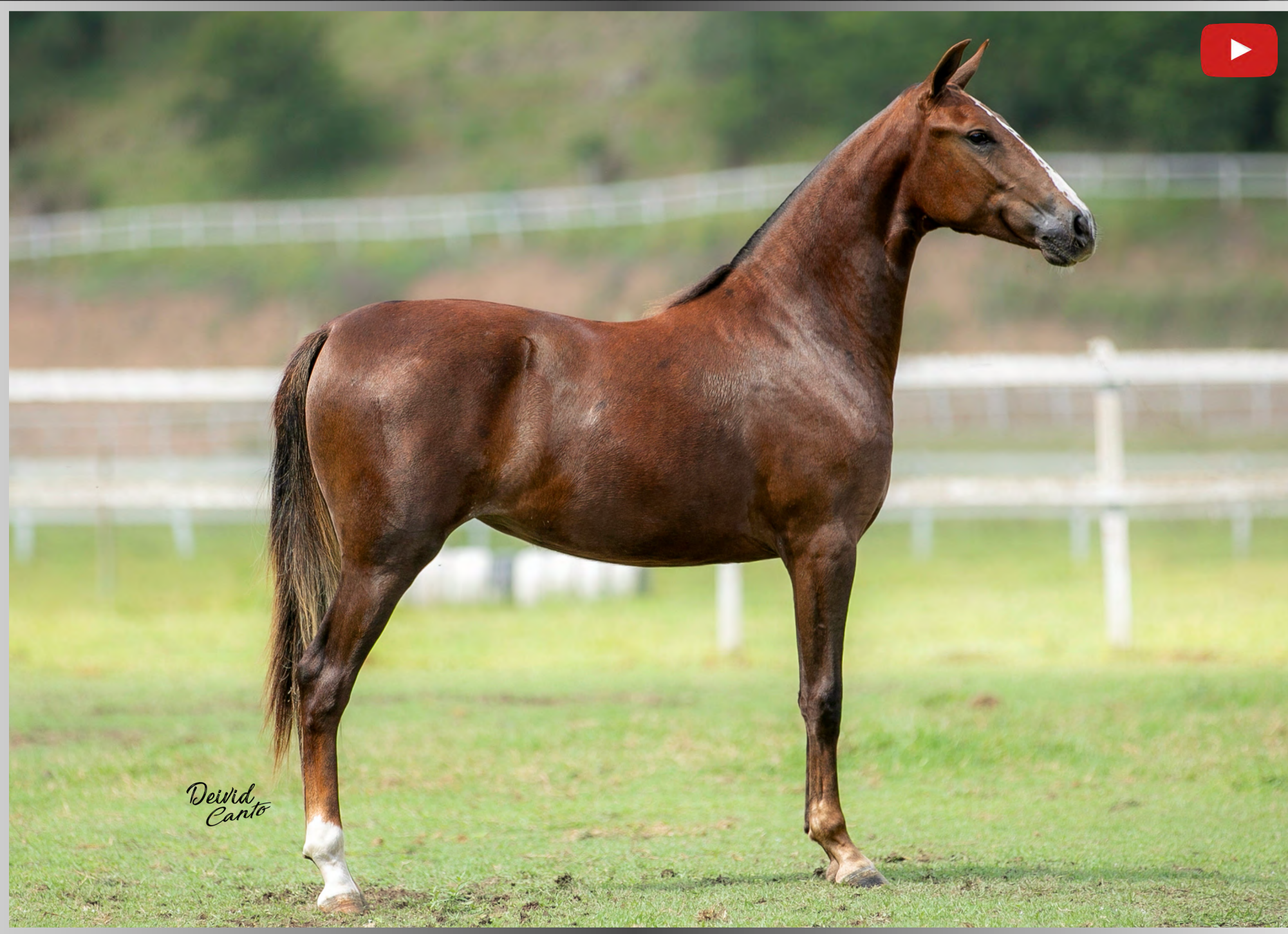
Seu Avô IATE DE ALCATÉIA

FÊMEA • NASCIMENTO: 15/12/2023 • VENDEDOR HARAS RFI - NOVA FRIBURGO/RJ