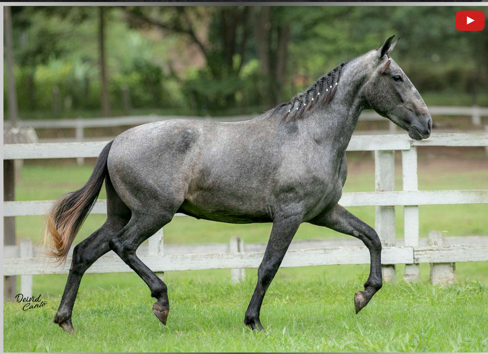
Seu Pai FUTURO FORMOSO 2S

MACHO • NASCIMENTO: 20/03/2023 • VENDEDOR HARAS RFI - NOVA FRIBURGO/RJ