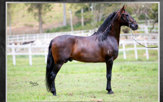
Seu Avô FUTURO FORMOSO 2S