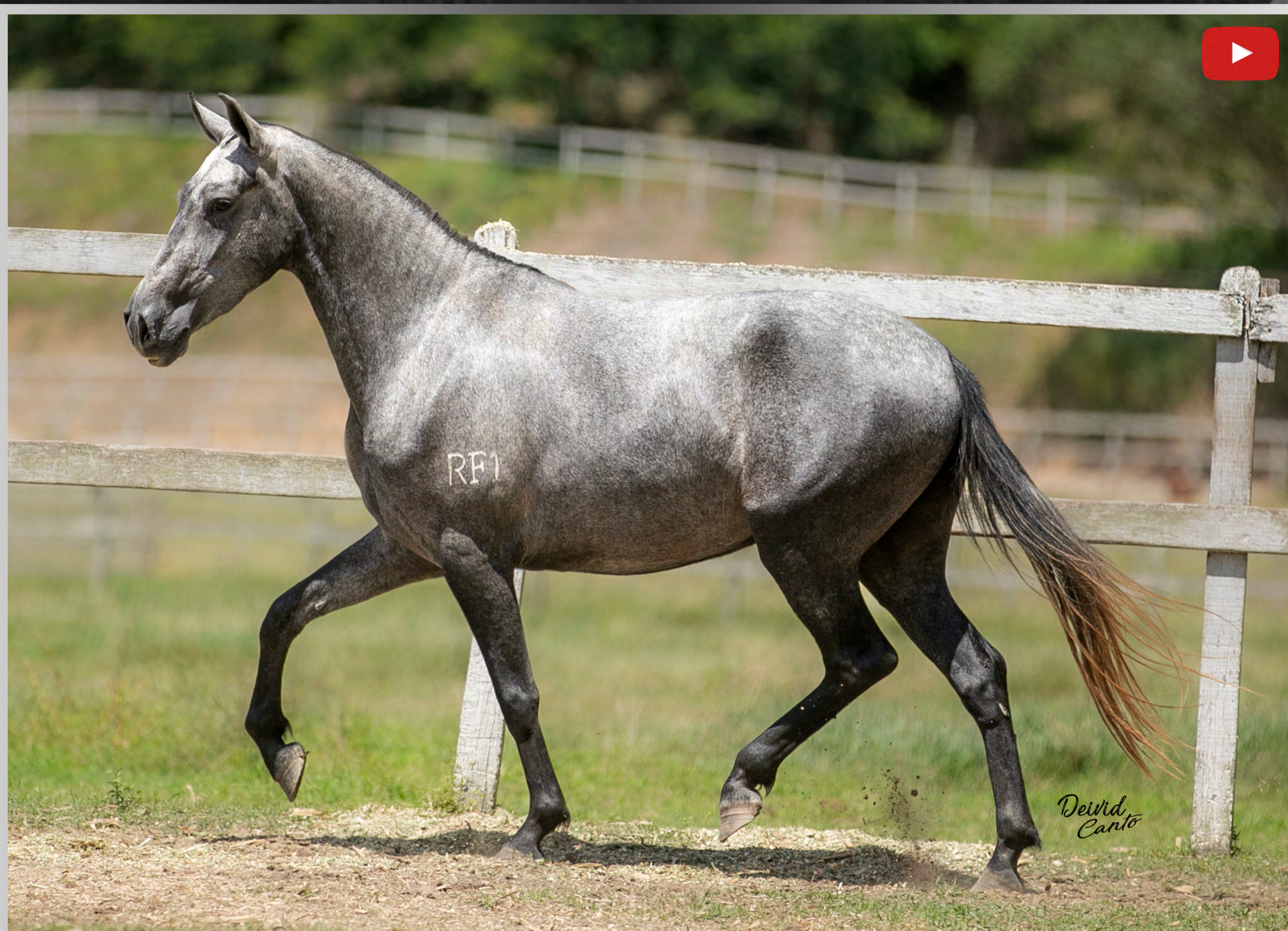
Seu Pai LOGAN RIO RASO

FÊMEA • NASCIMENTO: 15/02/2022 • VENDEDOR HARAS RF1 - NOVA FRIBURGO/RJ