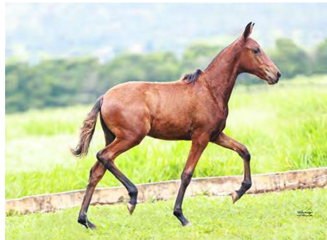
LADY DO YURI