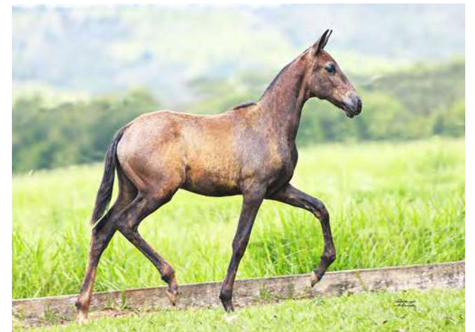
TEKILA DO YURI