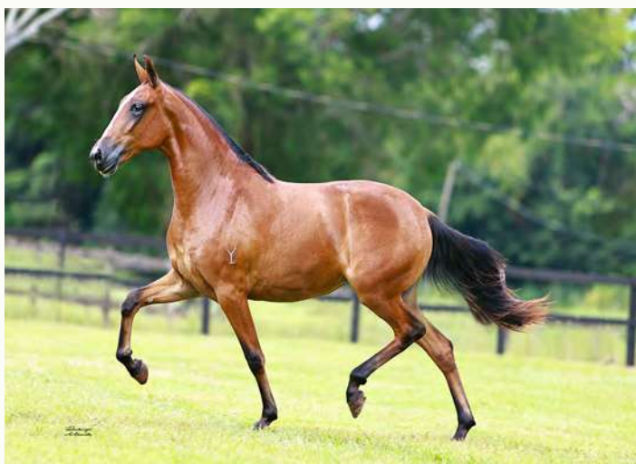
IVETE DO YURI