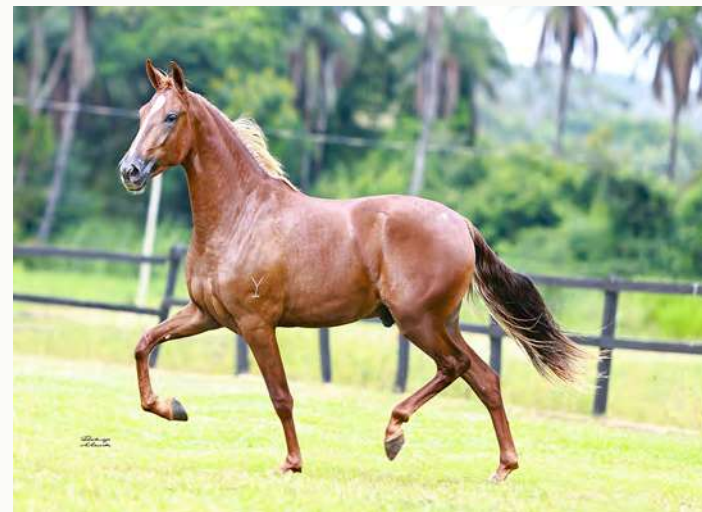
HAALAND DO YURI