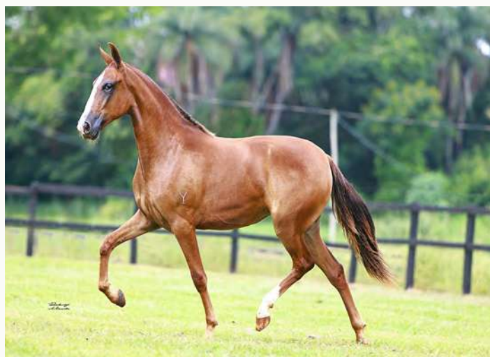
IONE DO YURI