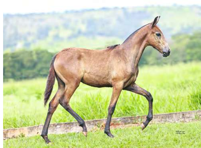
LIGEIRA TM DO YURI