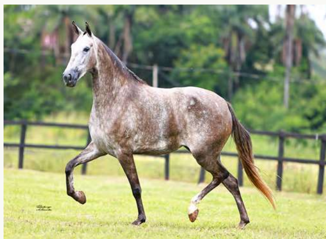
ÚNICA DO YURI