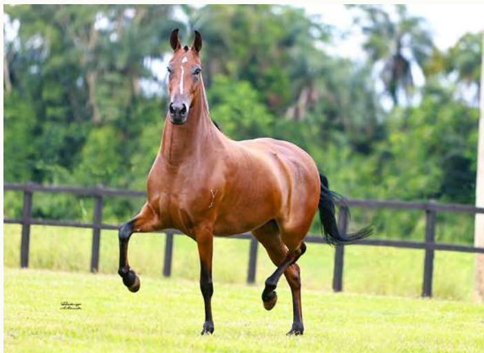
EVA DO YURI