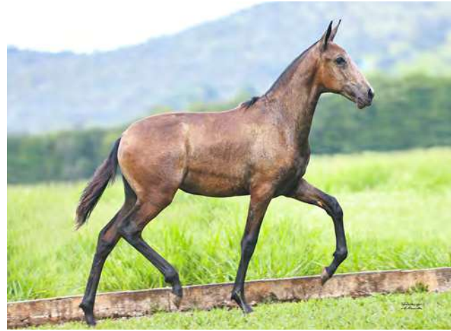
ARTEMIS DO YURI