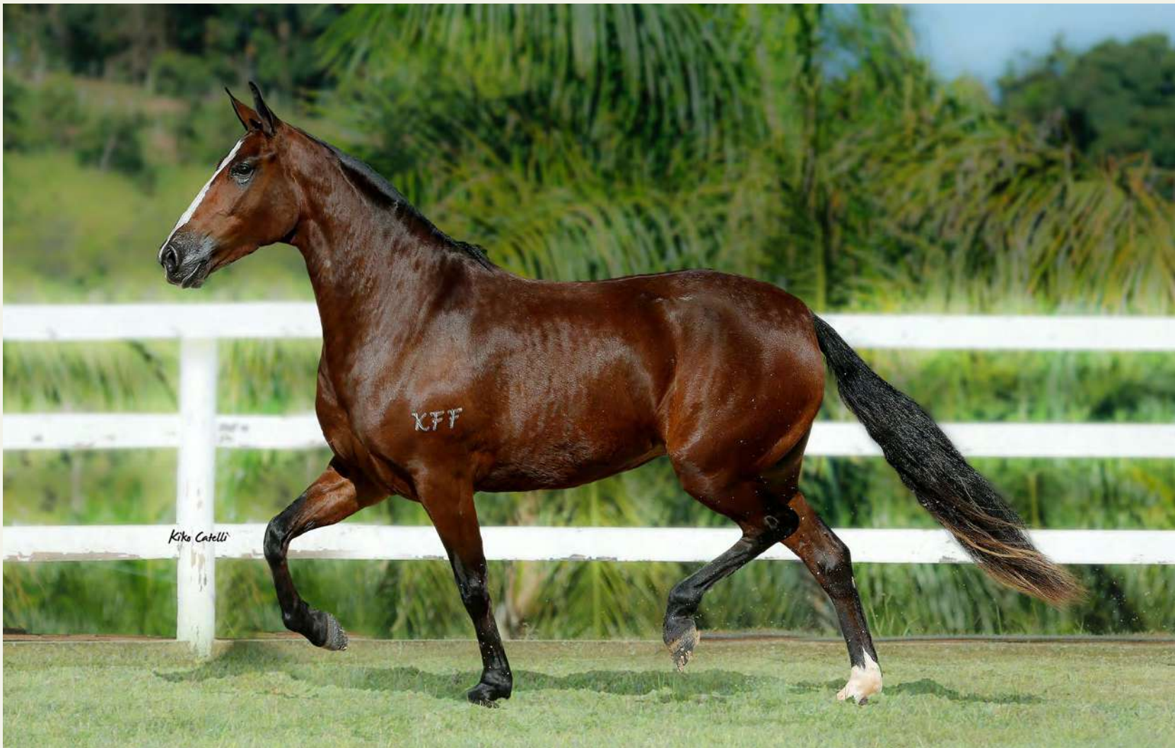
FIGURA PADRÃO DA MARCHA . 50%