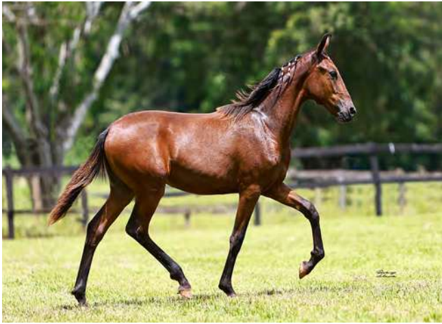
JB DO YURI