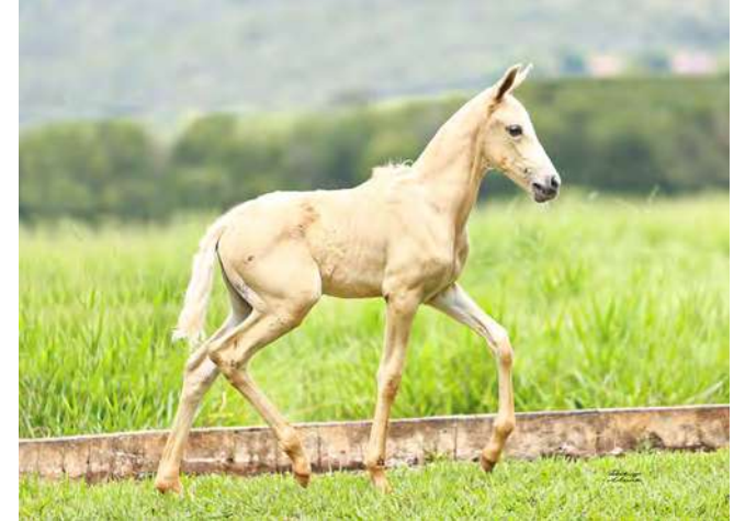
JÚLIA ROBERTS DO YURI