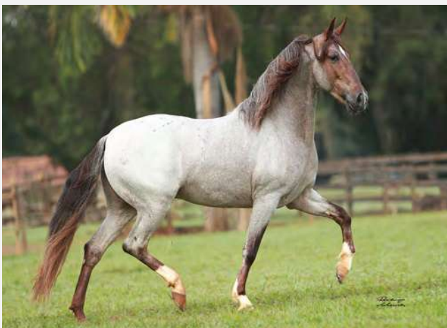
MESSI DO YURI