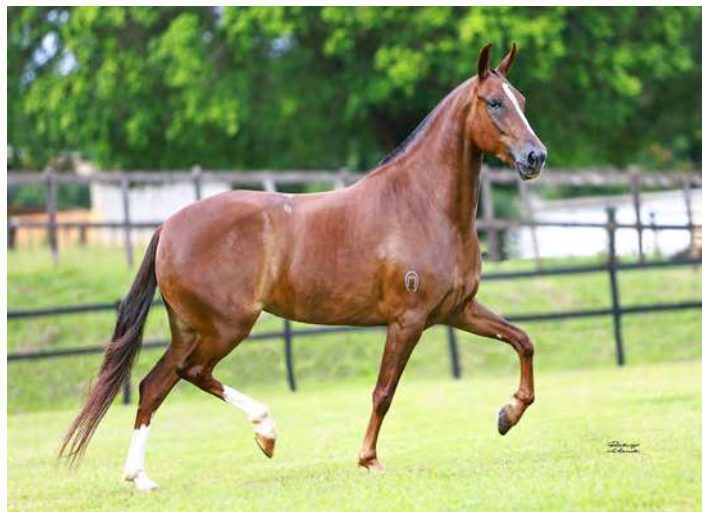
ELITE DO YURI