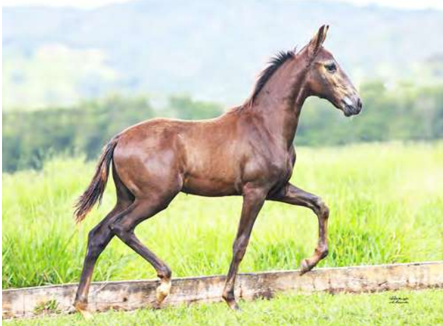
JABURU DO YURI